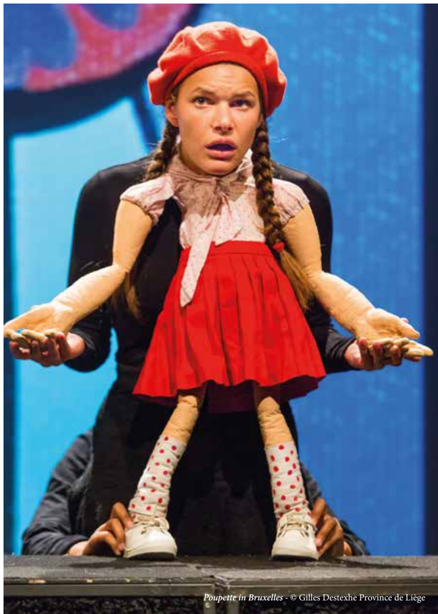
Poupette in Bruxelles